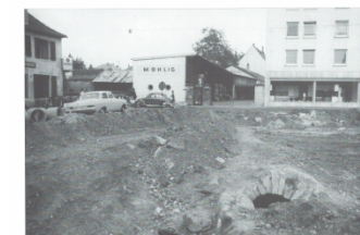
Auch ein unterirdischer Gang von der Weißquartierkaserne zum Festungswall wurde sichtbar. Am unteren Rand, in der Mitte des Bildes, sieht man wieder die Mauerreste der Festung.