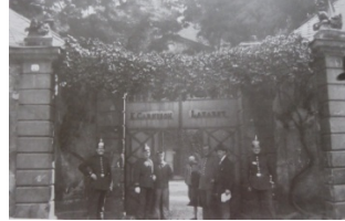
Eingang zum alten, im 1702 erbauten Garnisonlazarett in der Weißquartierstraße. Es war 1870 durch Pläne mit der großen Reichswehrkaserne „verbessert“ worden und soll das erste Militärhospital der Welt und das mit dem Kaiserhof in Berlin 1912 mit in sich gefassten Kaiserhofkaserne nachgebaut worden. Dieser sollte an dem Ort heute die Kaserne – das Bild vom Jahre 1902 zeigt den Reichswehrkaserne vor dem Einzug der 1. Kavallerie